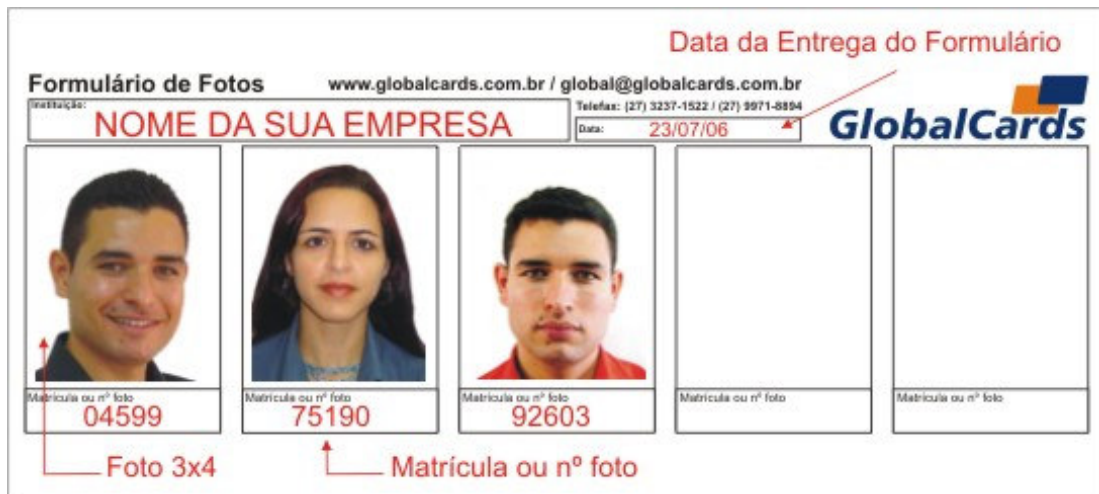
Fig. 2 - Formulário de Fotos, disponível para download no link: www.globalcards.com.br/form_fotos.htm

Utilize o nosso formulário de Fotos como demonstrado abaixo: